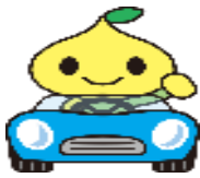
公式キャラクター ビットくん