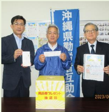
《昨年度「商品券プレゼント」抽選会》

会員の皆さまにおかれましては、益々ご清栄のこととお慶び申し上げます。 さて、沖縄県勤労者互助会では、日頃の感謝の気持ちを込め、また少しでも生活や暮らしが潤いあるものになるよう、会員の皆さまを対象に抽選で二〇〇名様に「商品券プレゼント(三千円分)」の取組みを実施いたします。 応募は十月一日から十二月三十一日までの期間で、詳しくは下記の応募要項をご確認ください。 なお、応募期間中における当会新規会員加入者は、すべて抽選対象者となりますので応募は不要となります。 多くの会員の皆さまのご応募をお待ちしております。